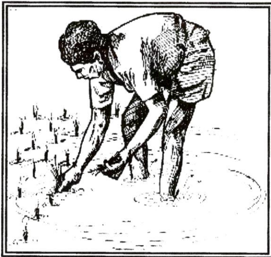
चित्र - 1